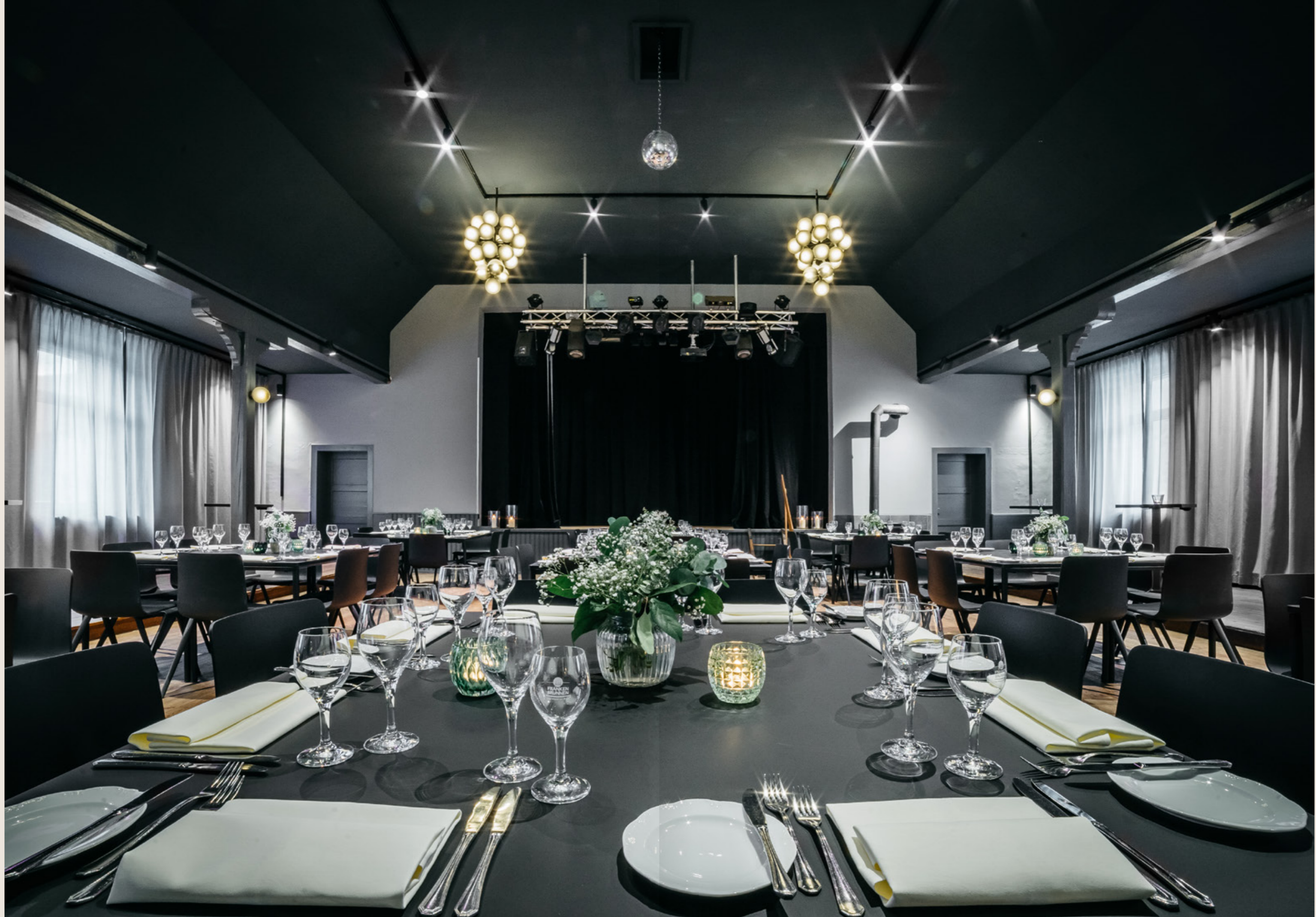
DAS HERZSTÜCK IM SCHWARZEN ADLER: UNSER PRÄCHTIGER FESTSAAL.