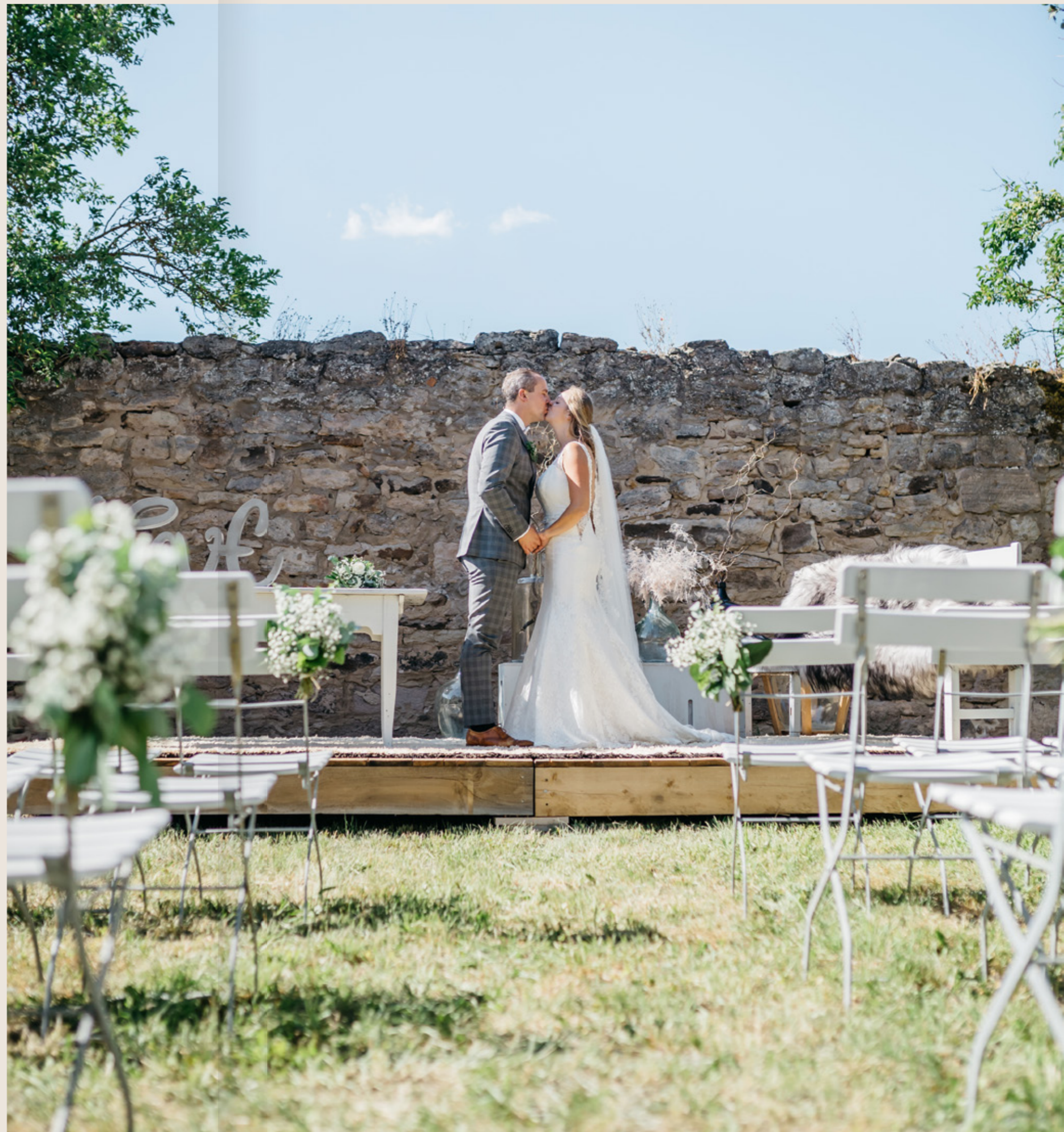
FEIERN SIE IHRE LIEBE AN EINEM BESONDEREN ORT.