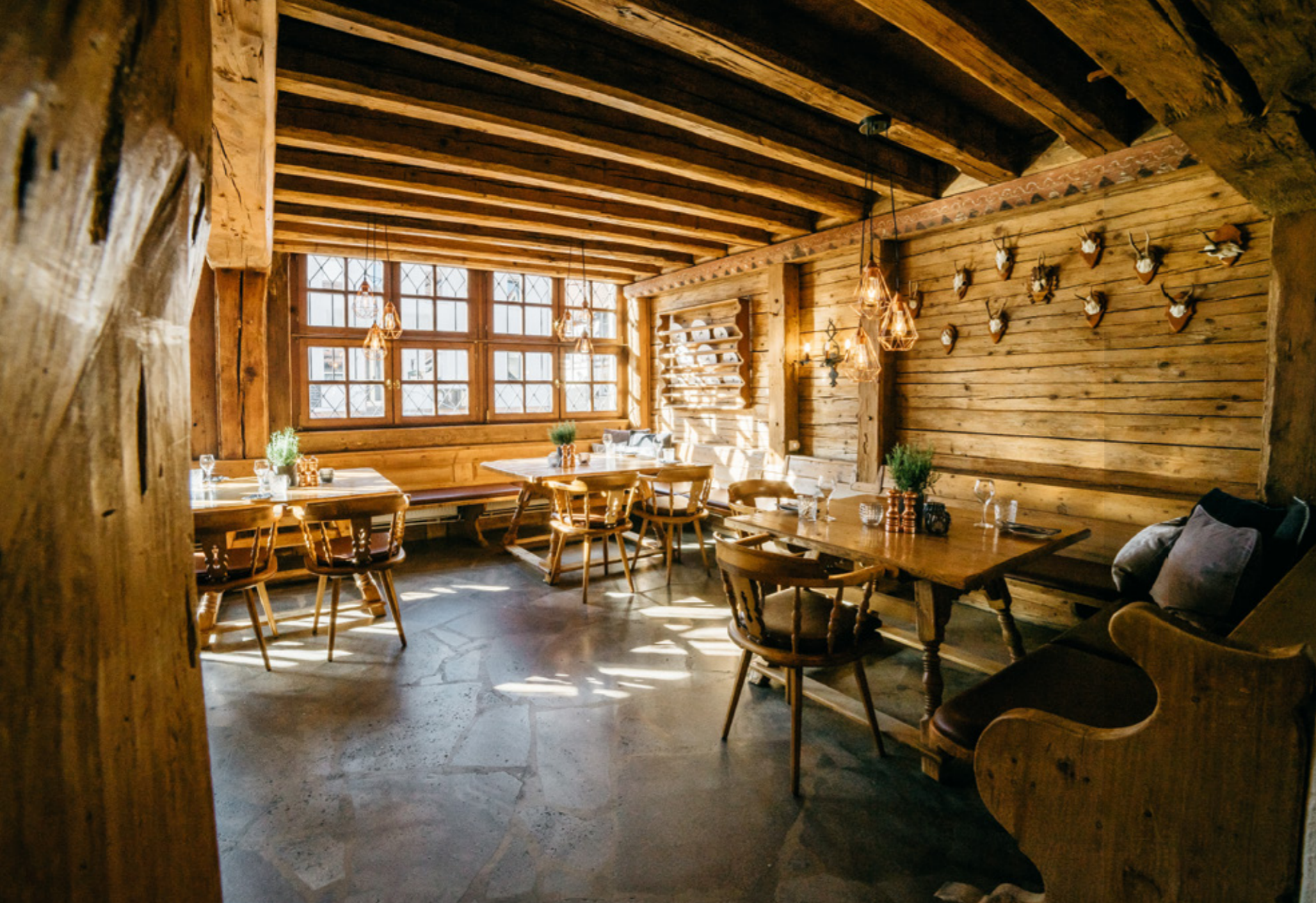
FESTLICH ODER GEMÜTLICH, GROSS ODER KLEIN. GANZ NACH IHREM GESCHMACK.